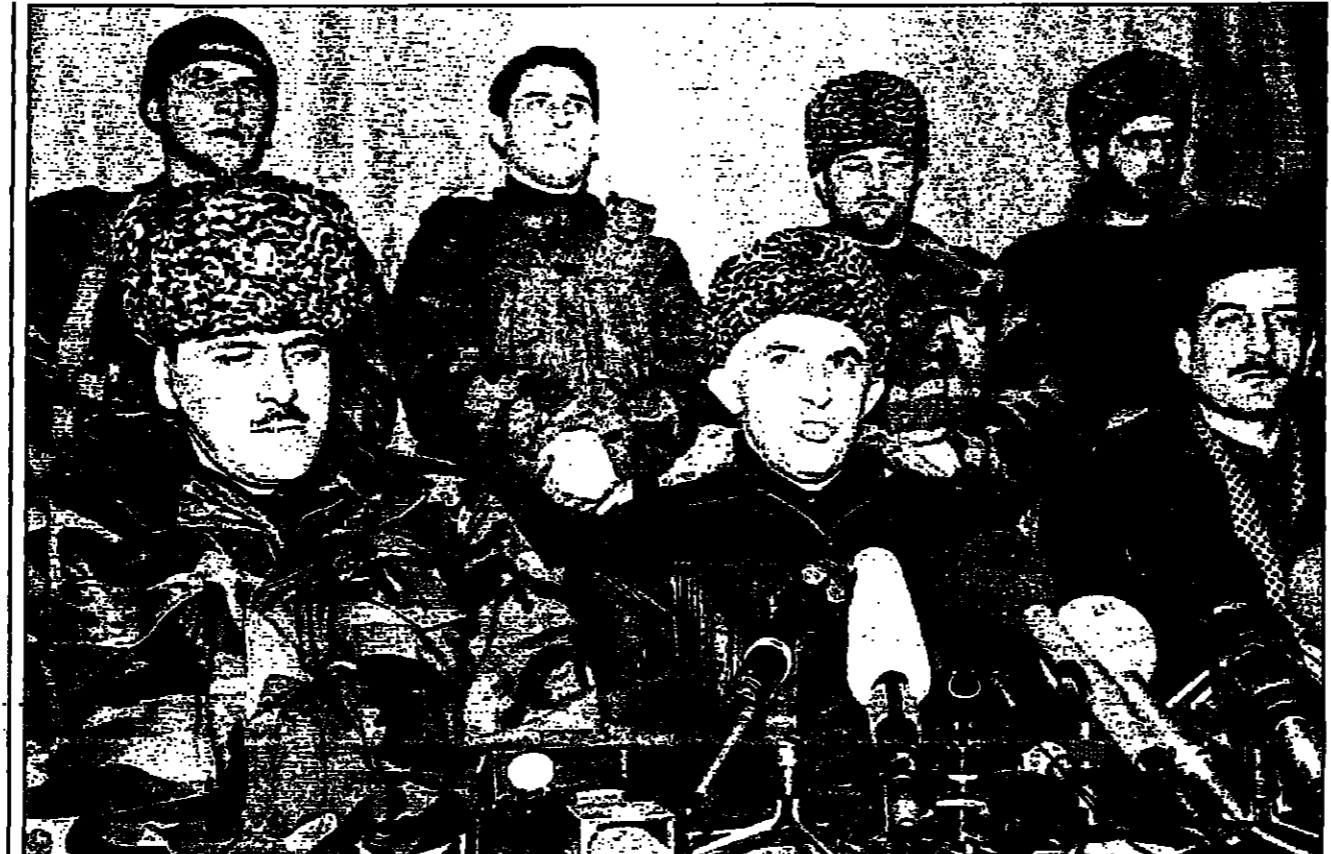
اصلاح مسخاروف يتوسط مساعديه في مؤتمر صحفي بعد اعلان فوزه في المرحلة الاولى من الانتخابات الرئاسية بالبحرين، وقد اكد الصحافيون انه لن يقلل بأي شيء اقل من الاستقلال التام لابلاده، ودعا دول العالم بما فيها روسيا للاعتراف بها

جزر حوار على سحمة العدل الدولية، بينما حاولت البحرين تجديد القضية بانتظار نتائج الوساطة السعودية بين البلدين، واعتبرت المصادر ان الرياض أصبحت ترفض حاجة ماسة الى توقيع لائحة بارسر وقت ممكن لاقادامه وجهها بعد اللشل لتكثرت الجهود الوساطة، وكانت وكالة الأنباء الخليج نسبت الى مصادر مطلعة القول بان اللجنة الرباعية تتفحص اجراءات وتصميم العلاقات بين البحرين وقطر سوف تحقق اجتماعها الرابع في جدة اليوم بدون حضور بولتي البحرين وقطر التي لم يتم منحها تصاريح لحضور هذا الاجتماع.